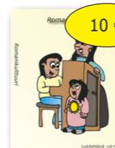
Romanikulttuuri 10 € cd-rom