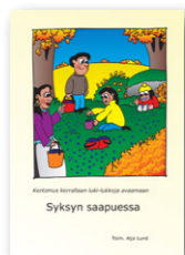
Syksyn saapuessa 117 sivua. ISBN 978-952-5803-04-4.