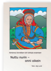
Nuttu nurin - onni oikein 79 sivua. ISBN 978-952-99919-8-3.