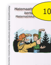
Matemaattisia käsitteitä kertaamaan 10 € Matematiikka maistumaan cd-rom