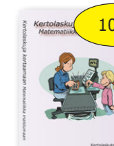
Kertolaskuja kertaamaan 10 € Matematiikka maistumaan cd-rom