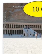
Kvalukutaito Egypti 10 € cd-rom