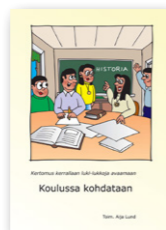
Koulussa kohdataan 119 sivua. ISBN 978-952-5803-05-1.