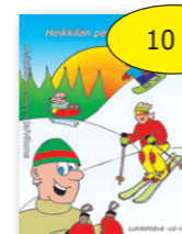
Heikkilän perheen talviloma 10 € cd-rom