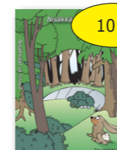
Nisäkkäät ja linnut 10 € cd-rom