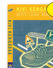
Kivi kengässä - mutta lujaa mennään dvd 10 € Kivi kengässä antaa eväitä lukivaikkeen käsittelemiseen oppilaitoksissa, työpaikoilla sekä vertaistukiryhmissä.