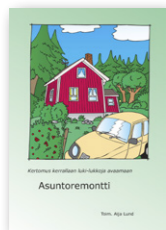
Asuntoremontti 123 sivua. ISBN 978-952-5803-03-7.