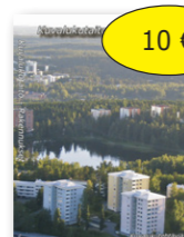
Kvalukutaito Rakennukset 10 € cd-rom