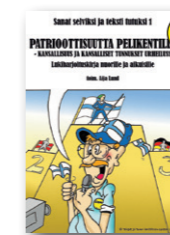
Patrioottisuutta pelikentillä 110 sivua. ISBN 978-951-96942-9-0.

Sanat selviksi ja teksti tutuksi -kirjat sisältävät harjoituksia erilaisiin lukemisen ja kirjoittamisen vaikeuksiin. Harjoitukset on jaettu kolmeen vaikeustasoon, ja kaikki tehtävät perustuvat kirjassa olevaan tekstiin, joka vaikeutuu tehtävien vaikeustason mukaan. Kirjoja voi käyttää lisämateriaalina opetuksessa tai eriyttää niiden avulla opetusta. Kirjat soveltuvat myös itsenäiseen harjoitteluun.