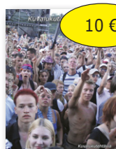
Kvalukutaito Henkilöt 10 € cd-rom