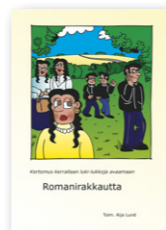
Romanirakkautta 111 sivua. ISBN 978-952-5803-08-2.