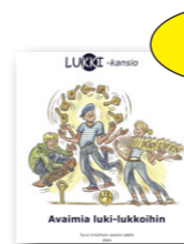
Lukki-kansio: Avaimia luki-lukkoihin 20 € Monipuolinen luki-kuntoutuskansio luki-kuntoutuksen ohjajalle ja itseopiskelumateriaaliksi. 98 sivua. ISBN 951-96942-4-2.