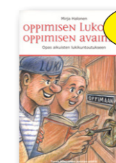
Oppimisen lukoista oppimisen avaimiin 20 € Harjoituskirja nuorten ja aikuisten lukiopetuksen sekä itsenäiseen lukitaitojen harjoitteluun. 128 sivua. ISBN 951-96942-3-4.