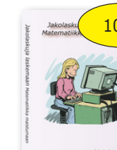
Jakolaskuja jakamaan 10 € Matematiikka maistumaan cd-rom