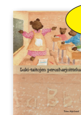
Luki-taitojen perusharjoittelua 20 € 111 sivua. ISBN 978-952-5803-22-8