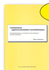
Testitehtäviä oppimisvaikeuksien kartoittamiseen 55 € Testitehtäväpaketti ryhmäseulontaan nuorille ja aikuisille. 19 sivua.