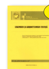
Lukemisen ja kirjoittamisen testejä 30 € Testejä ala- ja yläkouluun. 134 sivua. ISBN 978-951-97486-3-4