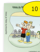
Vesa ja Pate kuntosalilla 10 € cd-rom