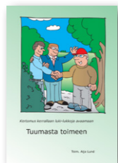
Tuumasta toimeen 71 sivua. ISBN 978-952-5803-01-3.