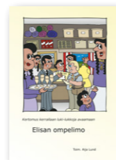
Elisän ompelimo 123 sivua. ISBN 978-952-5803-10-5.