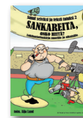
Sankareita, onko heitä? 96 sivua. ISBN 978-952-99919-0-7.