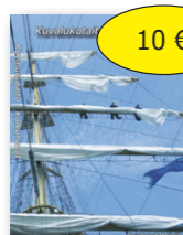
Kvalukutaito Kulkuneuvot 10 € cd-rom