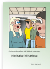
Kielitaito kiikarissa 93 sivua. ISBN 978-952-5803-07-5.