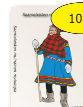
Saamelaisten muinainen mytologia 10 € cd-rom