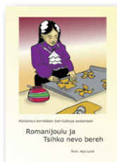
Romanijoulu ja Tshiko nevo bereh 141 sivua. ISBN 978-952-99919-1-4.