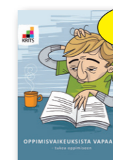
Oppimisvaikeuksista vapaaksi -käsikirja 15 € Teoriaa, tehtäviä ja kysymyksiä teemoista: oppimisvaikeudet, oppimistyylit, muisti, tarkkaavaisuus, itsetunto ja oppiminen.