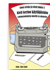
Kieli kertoo käyttäjästä 106 sivua. ISBN 978-952-99919-7-6.