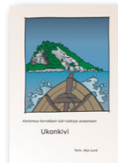
Ukonkivi 87 sivua. ISBN 978-952-99919-9-0.